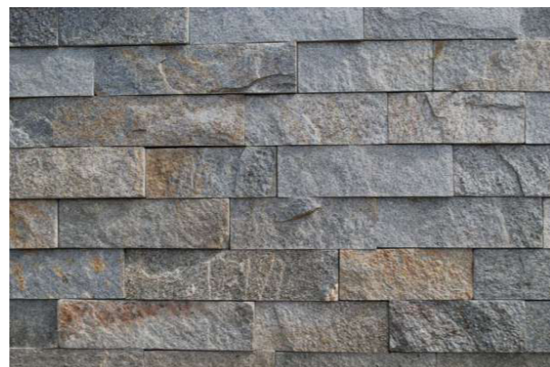
OKŁADZINA KAMIENNA - CIĘTA, GNEJS, KOLOR SZARY METALICZNY